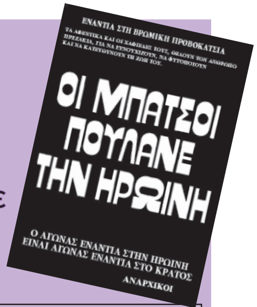
Αφίσα που κολλήθηκε στις γειτονίες της Αθήνας την δεκαετία του 80' και παραμένει ακόμα επίκαιρη.

Σημαντικό σημείο της στρατηγικής αυτής είναι η συσκοτίση διάφορων θεμάτων και η προβολή τους ως μεμονωμένων, για να ξεχνάμε ότι είναι κομμάτι αυτού του πλάνου. Ανά τακτά χρονικά διαστήματα εμφανίζονται ειδήσεις στα δελτία των 8 για μπάτσους αρχηγούς και μέλη διακίνησης ναρκωτικών με τίτλους, όπως «Εξαρθρώθηκε κύ-